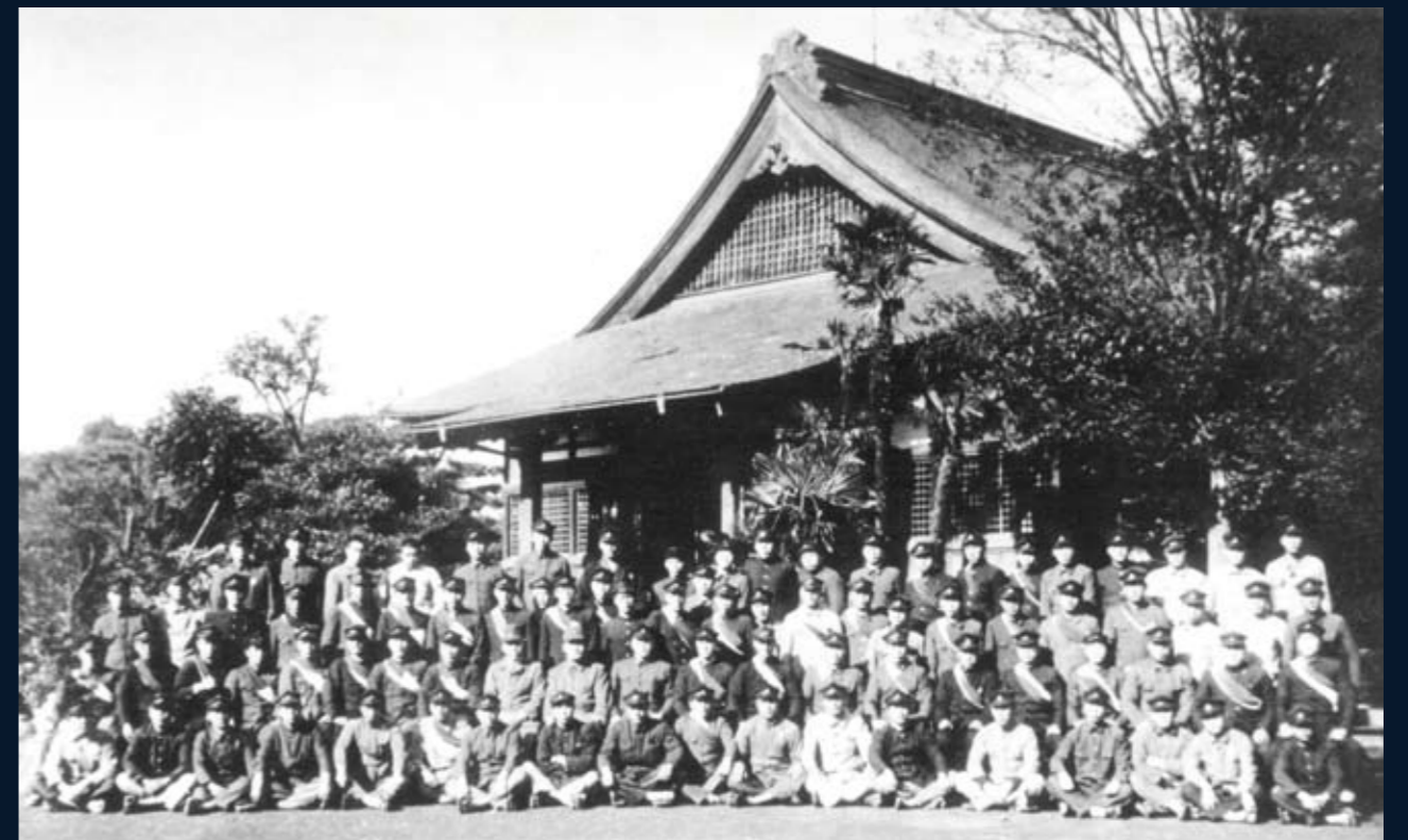
1943（昭和18）年12月頃 学徒出陣

戦争の影響は、学内外で行われる軍事教練の拡大ほか、繰上卒業や制服の国民服への変更などにも及んだ。