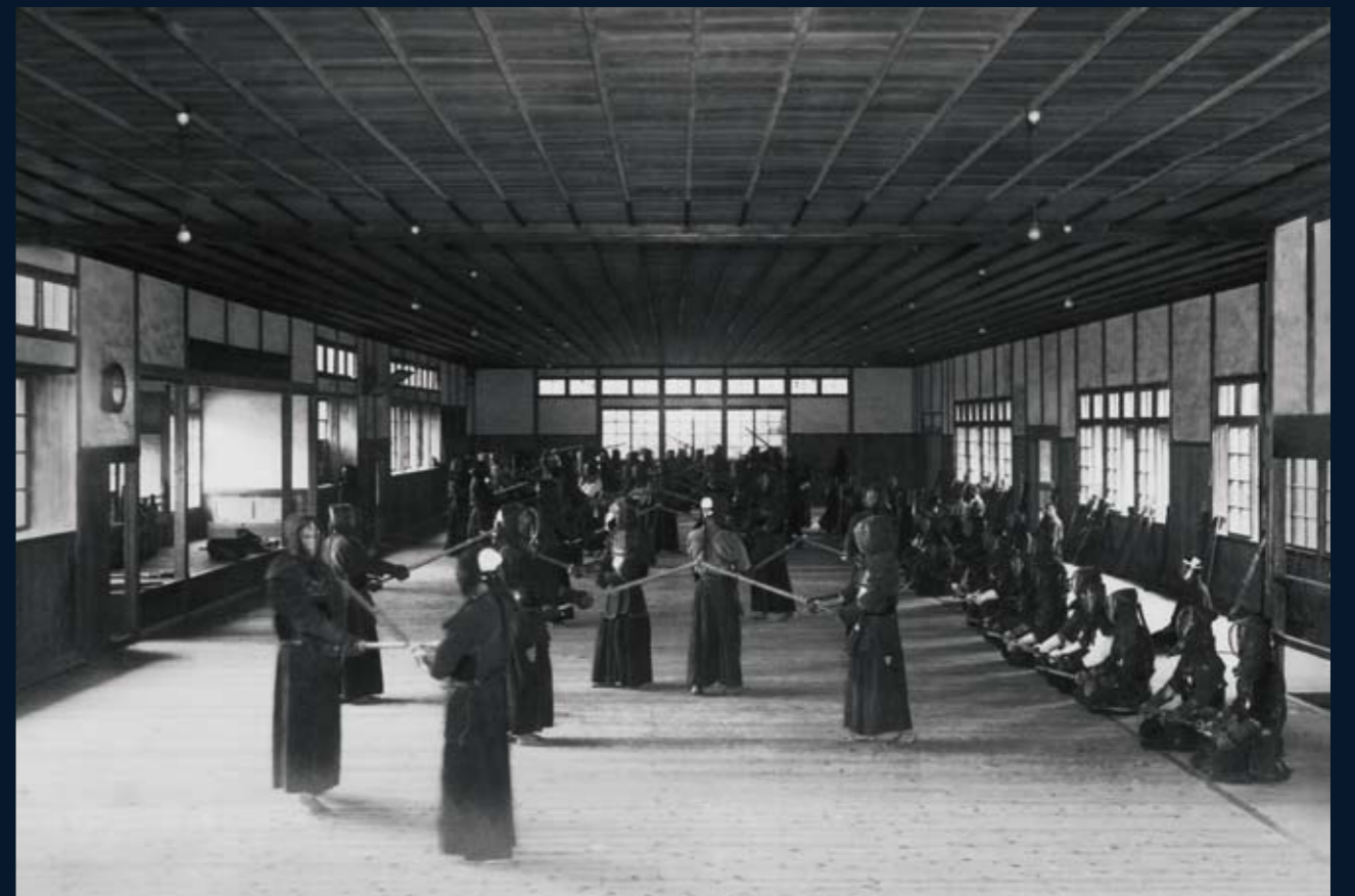
1942 (昭和17) 年頃 武道教育

専門学校の学生は、朝夕の武道稽古と勉学に励み、寮での共同生活を通じて、人格の形成を図った。