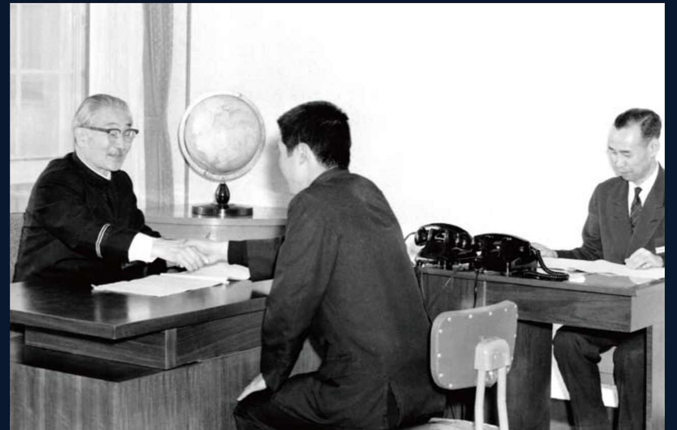
1967（昭和42）年2月 館長の「卒業面接」 全学生が館長の担当する「卒業面接」を受け、国士館で修得した智識を確認し、社会へ巣立って行った。

国士館は、その後、政経、工、法、文学部を次々に開設し、 中学・高校・大学・大学院を擁する総合大学へと発展を遂げた。 柴田徳次郎は、学生・生徒が急増しても必ず自ら訓話を行い、 卒業面接を実施するなど、常に学生・生徒に直接接して教育に心血を注ぎ続けたが、 1973（昭和48）年1月26日、すべてを教育に捧げ尽くした83年の波瀾の生涯を閉じた。 その後、国士館は時代の変化に応じ、 学園の近代化と諸改革を推し進め、情報化やグローバル化など、 社会が大きく変容する時代にあっても、 柴田徳次郎の遺した教育の伝統を引き継ぎ発展してきた。 今や国士館を巣立った卒業生は15万人に上り、 教育者 柴田徳次郎の志を受け継ぎ広く各界で活躍している。