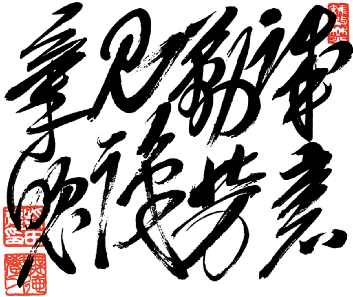
柴田徳次郎筆「誠意・勤労・見識・気魄」（右より）

柴田徳次郎が、自著『国士館と教育』（大正15年）に「国士館の主義」として掲げた四徳目。 国士館教育の指標として寄附行為や学則にも謳われてきた。