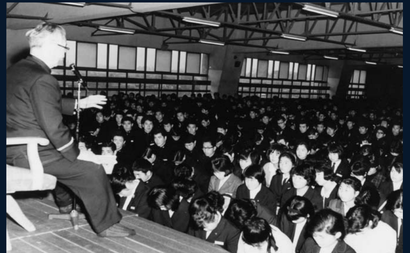
1965 (昭和40) 年4月 館長訓話

言道部は、自己の信念表明が真の「国士」を育むという信条のもと、他学との交流を盛んに行った。