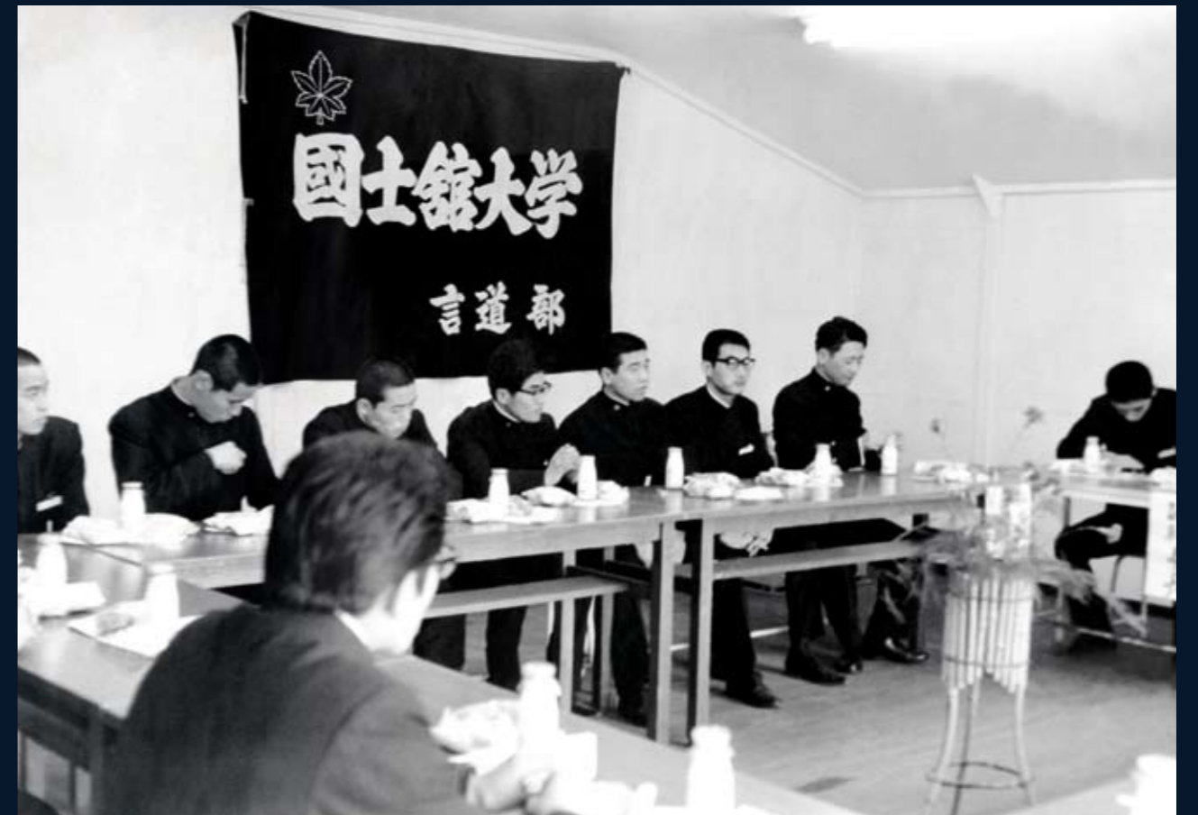
1965 (昭和40) 年1月 言道部の活動

言道部は、自己の信念表明が真の「国士」を育むという信条のもと、他学との交流を盛んに行った。