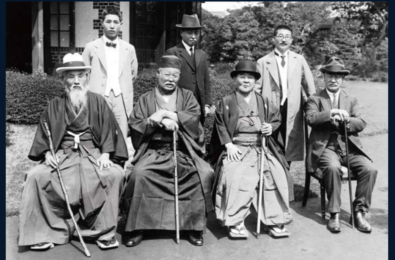
1926（大正15）年 国士館維持委員会の支援 維持委員会には、国士館の教育に賛同する各界の名士が参集し、財団運営への支援が図られた。 （前列左より頭山満、野田卯太郎、渋沢栄一、徳富蘇峰、後列左より花田半助、渡辺海旭、柴田徳次郎）

まず、高等部・中等部を開設し、次いで法令に準拠して、1925（大正14）年に中学校を設置、翌年には勤労青年のための商業学校を、さらに1929（昭和4）年に教員養成を目的とする専門学校を設置する。館長となった柴田は、『国士館と教育』（大正15年）を著し、「誠意・勤労・見識・気魄」の四徳目を教育の理念に掲げ、学風の確立を図った。