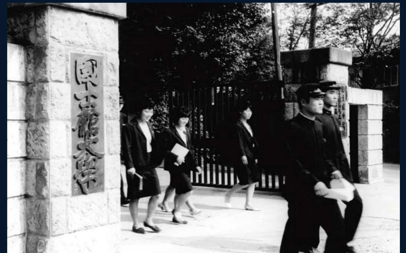
1963（昭和38）年7月 賑わうキャンパス

国士館の復興を支えた各界の名士の手で「国士館再建趣意書」が策定され、法人経営の再建が図られた。 (左手前より安川第五郎、木村篤太郎、有田八郎、森田久、緒方竹虎、松野鶴平、出光佐三、1人おいて古野伊之助、石井光次郎、右奥に柴田徳次郎)