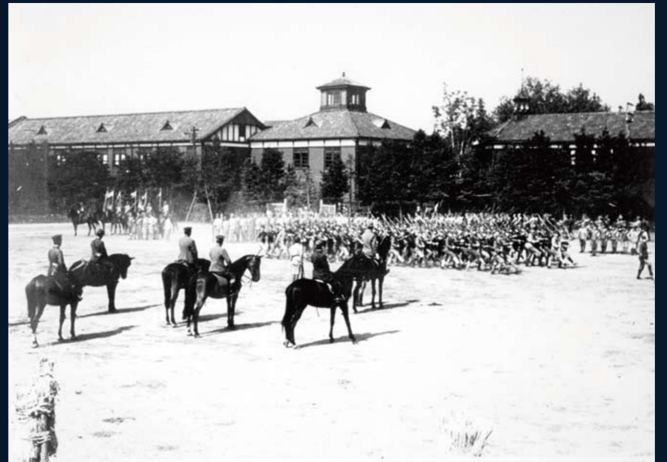
1942（昭和17）年7月 軍事教練

戦争の影響は、学内外で行われる軍事教練の拡大ほか、繰上卒業や制服の国民服への変更などにも及んだ。