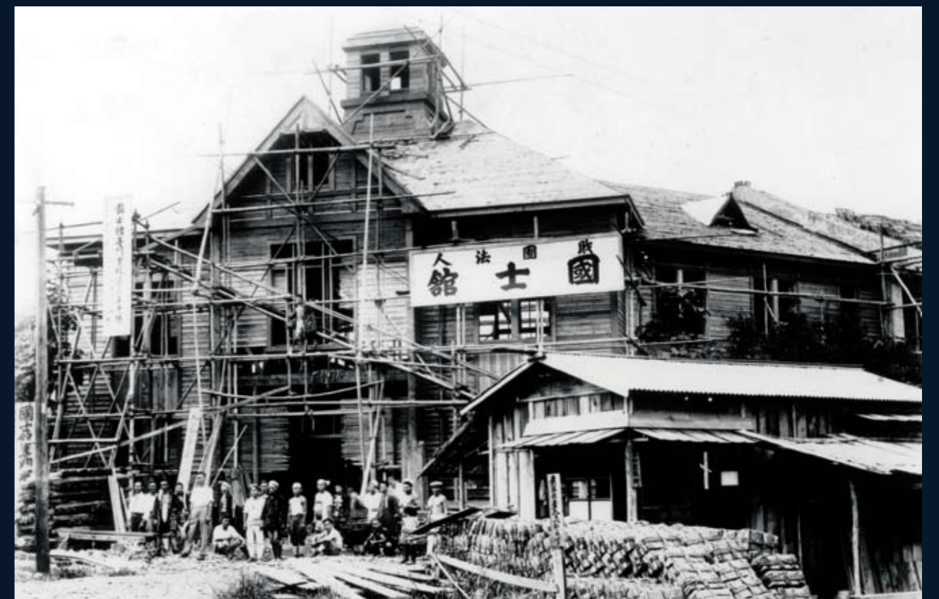
1930（昭和5）年 建設中の専門学校校舎 諸学校の設置にあわせて、校舎の新設と拡充が順次進められ、教育の環境が整えられた。