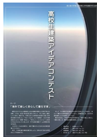
チラシ(本リリースに添付)

※応募要項は大学ホームページ( https://www.kokushikan.ac.jp/faculty/SE/news/details_16023.html )および建築学系ホームページ( https://kokushikan-arch.net/ )に掲載しています。(以下にQRコード記載)