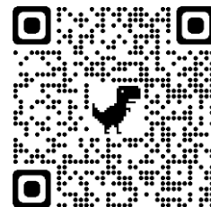
建築学系ホームページ