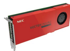
SX-Aurora TSUBASA A100シリーズ